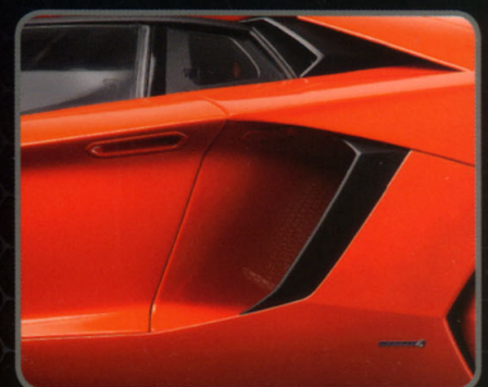
Scherentüren mit Hydraulikmechanismus Scissor doors with hydraulic mechanis