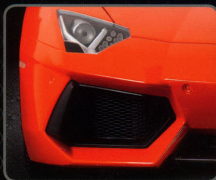
Superdetaillierte Scheinwerfer (2 x 13 Teile) Perfectly detailed headlights (2 x 13 pieces)