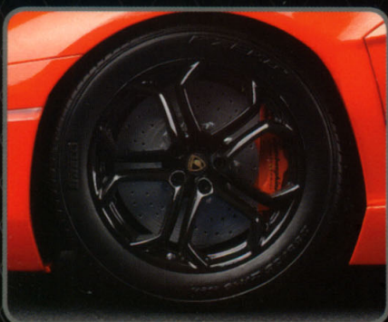
Hochglanzlackierte Felgen Glossy painted wheel rims

In keeping with the Pocher tradition the car body of the 7 Kg model is made of premium metal die-cast and comes ready painted. The kit is easy to build and can be assembled for both left-hand and right-hand drive. The 1:8 sportster kit consists of more than 600 parts made of an assortment of materials including metal, rubber, textiles and premium quality plastic. Many parts are simply screwed. Of course steering, suspension and spoiler mechanism are functional with doors and hatches being capable of being opened.