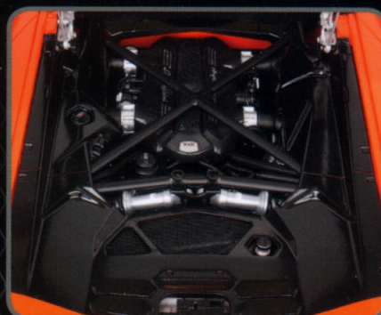
Perfekt detaillierter Motorraum Perfectly detailed engine bay